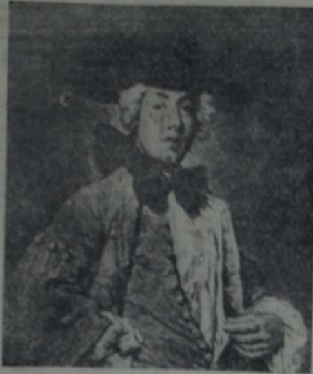
VICTORIO GHISLANDI — "Retrato".